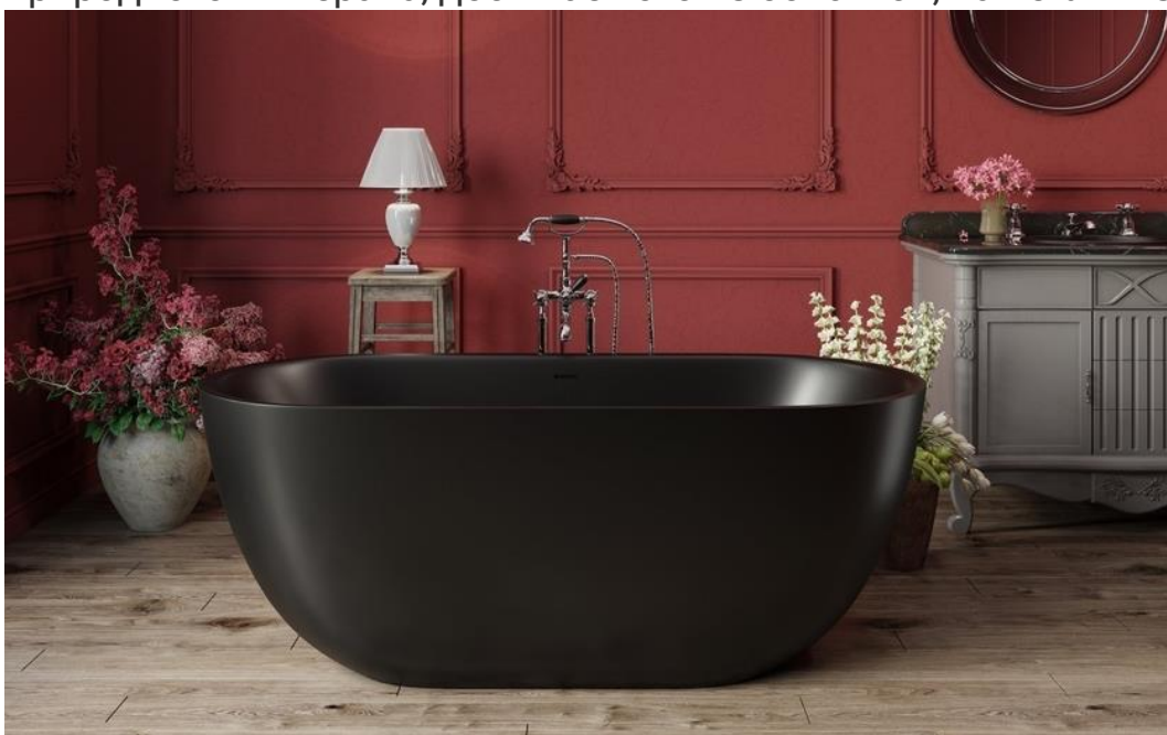
Corelia — отдельностоящая каменная ванна

Лаконичный дизайн, закруглённые линии корпуса, тактильно приятная поверхность, отполированная или бархатистая, — вот характерные, узнаваемые черты каменных ванн Viva Lusso. Литой камень AquateX™, из которого они сделаны, — инновационный композитный материал с уникальными свойствами (технология Solid Surface). Это экологичный, гипоаллергенный, огнестойкий, устойчивый к ультрафиолетовому излучению, абсолютно безопасный материал с исключительно приятной текстурой. На 60% процентов он состоит из природного минерала, добываемого из бокситов, на 40% — из акриловых смол.